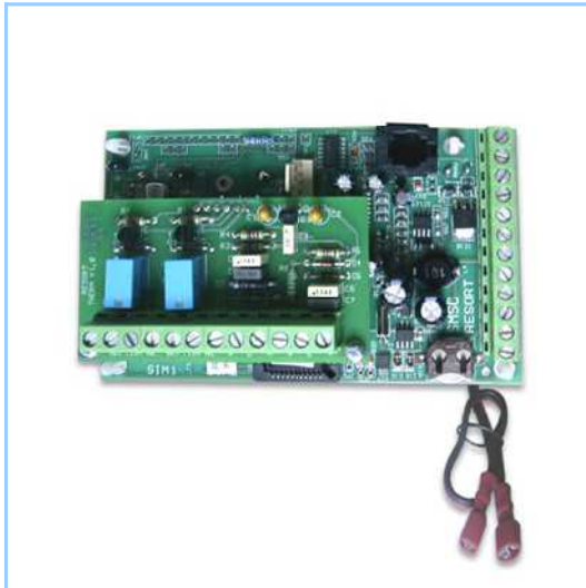
TERMO-COM (panel kivitel)

A TERMO-COM 8 PS akkumulátorral kiegészítve áramkimaradás esetén is szünetmentesen üzemel.