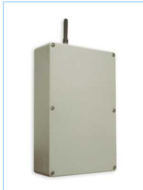
TERMO-COM PS (műanyag dobozos kivitel)